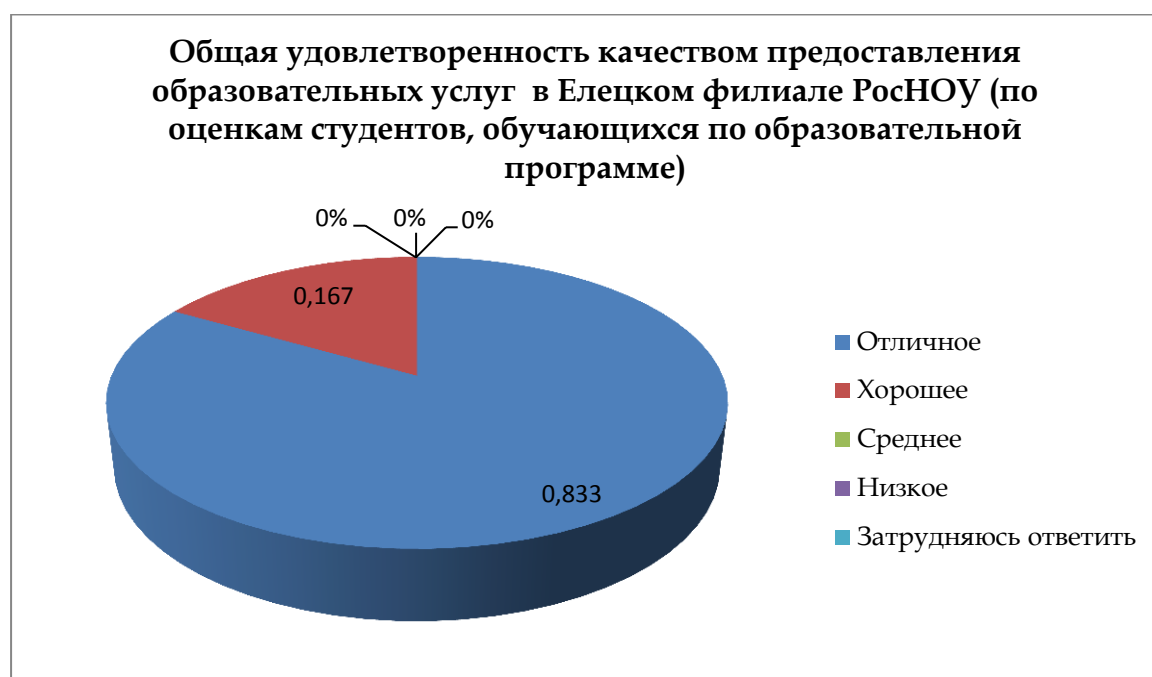
Рисунок 2. Результаты анкетирования по вопросам удовлетворенности качеством получаемых образовательных услуг, проведенного с 11 по 25 декабря 2023 года среди обучающихся по образовательной программе (вопрос № 20 - «Оцените в целом качество организации образовательного процесса в Елецком филиале РосНОУ»)

Результаты проведенного анкетирования представлены на диаграмме на рисунке 2.