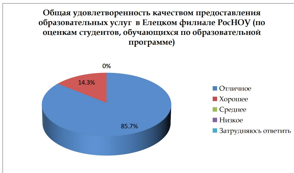
Рисунок 2. Результаты анкетирования по вопросам удовлетворенности качеством получаемых образовательных услуг, проведенного с 15 по 30 декабря 2025 года среди обучающихся по образовательной программе (вопрос № 20 - «Оцените в целом качество организации образовательного процесса в Елецком филиале РосНОУ»)

Результаты проведенного анкетирования представлены на диаграмме на рисунке 2.